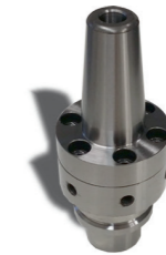
Schrumpfaufnahme, radial ausrichtbar

zur Aufnahme von mittleren bis großen Flycutter-Scheiben